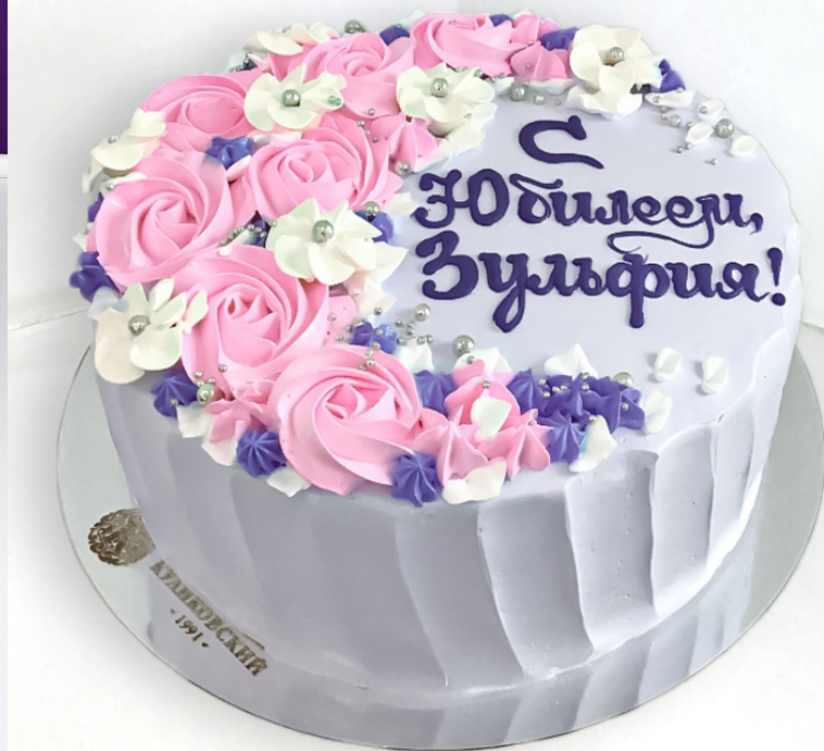
X-12 от 2 кг