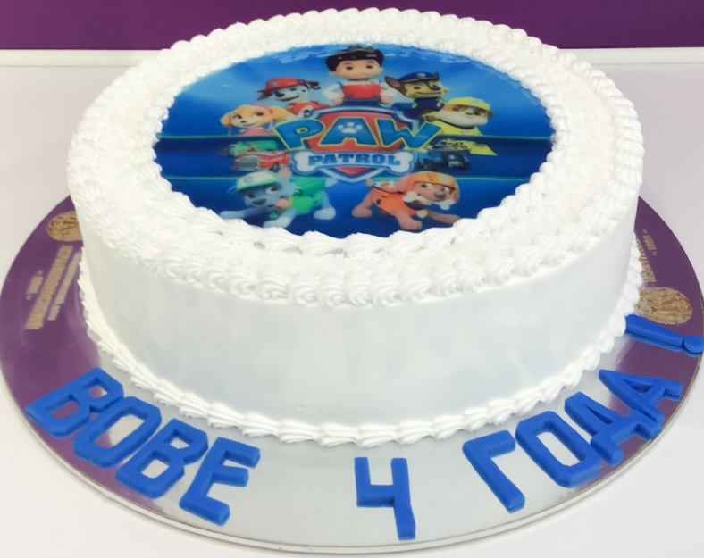
X-9 от 2 кг