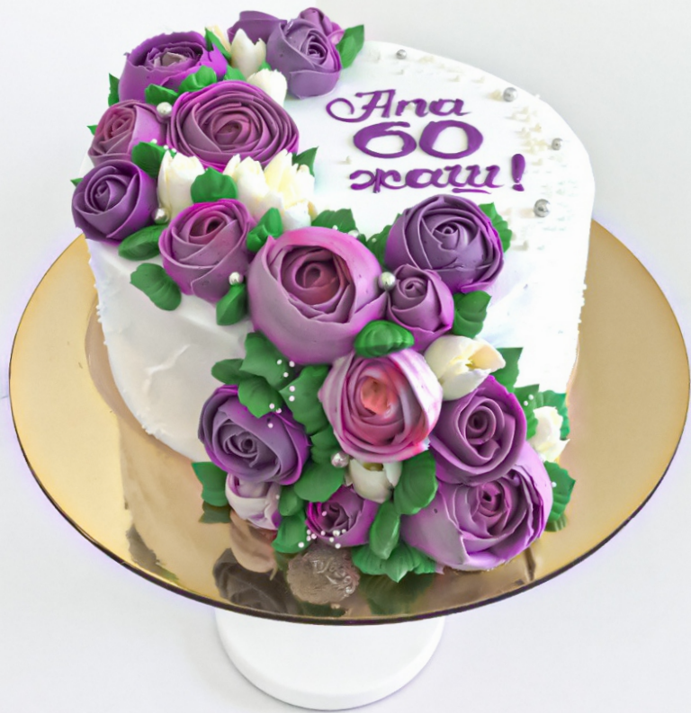
X-1 от 2 кг