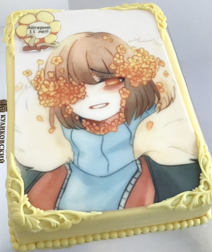
X-15 от 2 кг