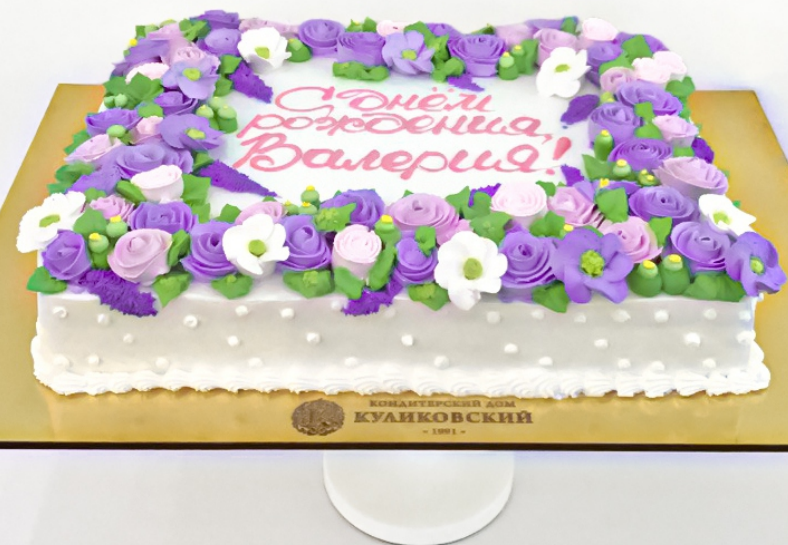
X-3 от 2 кг