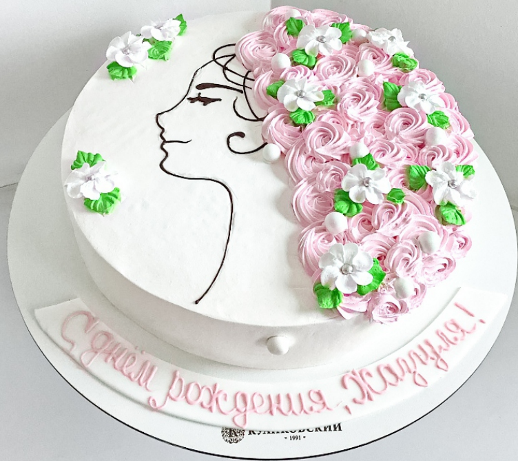
X-5 от 2 кг