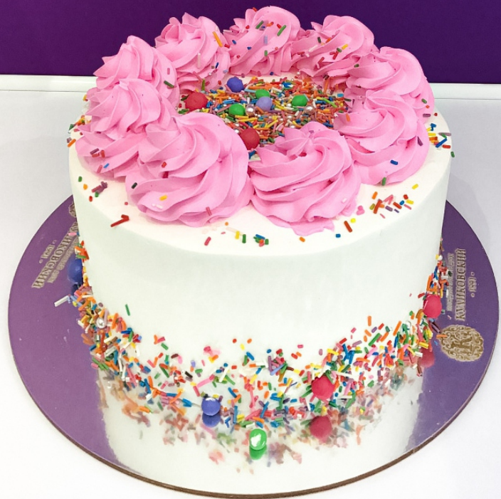
X-11 от 2 кг