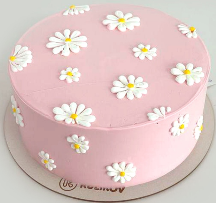
X-17 от 2 кг