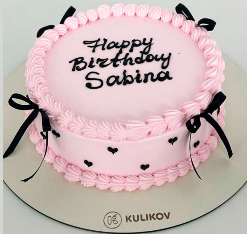
X-18 от 2 кг