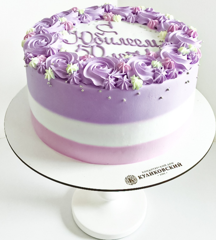
X-2 от 2 кг