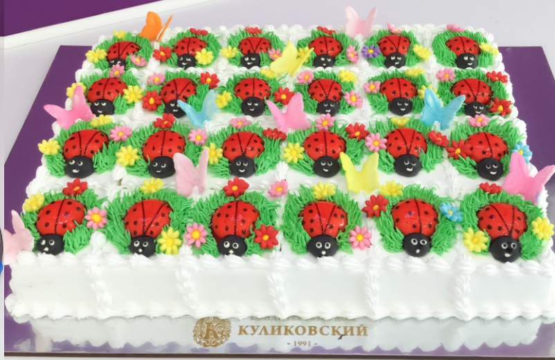
X-10 от 2 кг