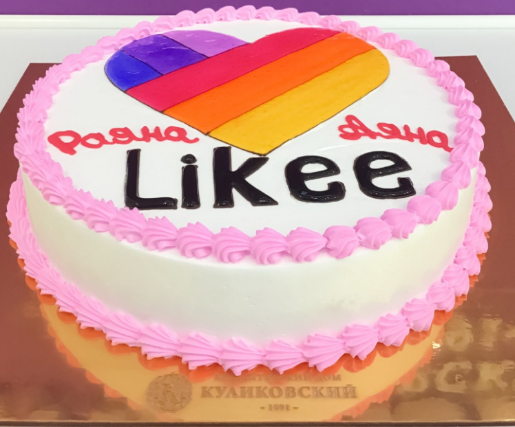
X-7 от 2 кг