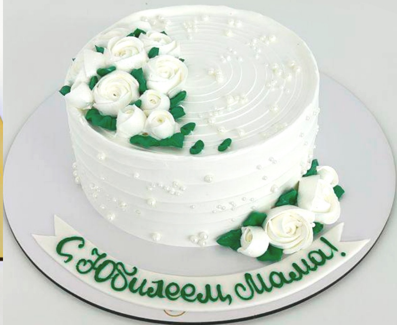
X-4 от 2 кг