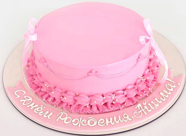
X-6 от 2 кг