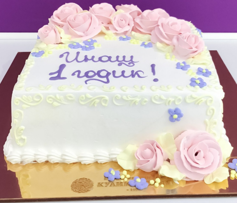
X-8 от 2 кг